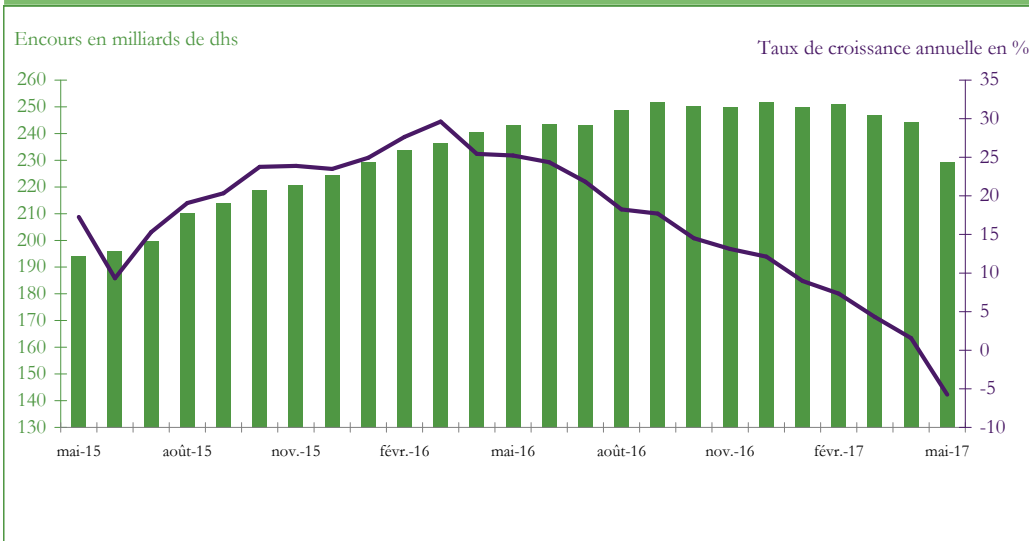
Graphique 3 : EVOLUTION DES RESERVES INTERNATIONALES NETTES